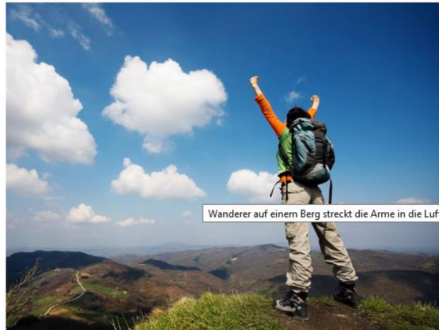
Wanderer auf einem Berg streckt die Arme in die Luft

Anhand von sieben Fragen filtert Ihnen der Online-Auslandsberater die Programme und Stipendien heraus, die für Sie in Frage kommen. Alle Angaben sind anonym. Die Ausgaben des Systems sind programmneutral und trägerübergreifend.