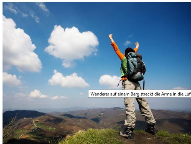
Wanderer auf einem Berg streckt die Arme in die Luft

Anhand von sieben Fragen filtert Ihnen der Online-Auslandsberater die Programme und Stipendien heraus, die für Sie in Frage kommen. Alle Angaben sind anonym. Die Ausgaben des Systems sind programmneutral und trägerübergreifend.